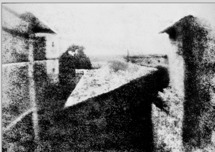
1 Point de vue du Gras, Nicéphore Niépce

Hij noemde zijn procedé 'heliografie', wat geschreven met zonlicht betekent. Fotografie als woord moest nog bedacht worden. Het beeld is gespiegeld omdat hij gebruik maakte van een lens waarin het licht door een brandpunt ging zodat links naar rechts en boven naar onder draaien. Zet de foto rechtop en je ziet een spiegelbeeld. Overigens kon met diepdrucktechniek een positief ontspiegeld beeld worden verkregen van dezelfde afmeting. Opmerkelijk aan het beeld is de belichting. Die duurde vele uren waardoor de objecten zowel links als rechts in het beeld door de zon zijn beschenen